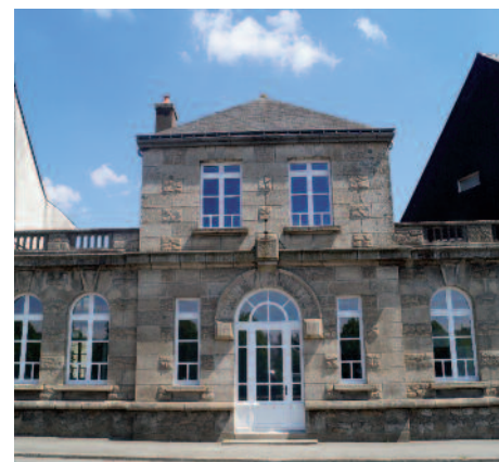
Le local des Bains-Douches est transformé en résidence d'artiste

la Mairie et le Conseil général. Ce document précise les modalités d'exposition - aux Bains-Douches, mais aussi au domaine de Kerguehennec - ainsi que les heures d'ouverture destinées aux visites des groupes scolaires. La grande salle située à gauche de l'édifice accueillera l'atelier de création principal tandis qu'un lieu de travail plus petit occupera l'espace opposé. Les baies vitrées situées sur la façade arrière donnent sur un superbe jardin de ville. La partie centrale qui constitue le hall d'entrée, sera destinée aux différentes expositions. L'étage, quant à lui, est aménagé en appartement. L'aspect extérieur sera préservé. Les Bains-Douches sont en effet situés dans le périmètre de l'AVAP (Aire de mise en Valeur de l'Architecture et du Patrimoine) et conserveront, à ce titre, leur caractère historique.