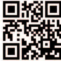
QR code de la mairie

Pour la première fois, des QR codes sont insérés dans votre journal. Ces carrés noir et blanc ou de couleurs permettent de consulter, via un smartphone, des sites web, des images, des vidéos, etc. Pour lire un QR Code, il vous faut : un téléphone mobile type smartphone, un accès à Internet depuis votre téléphone mobile et une application vous permettant de lire les QR codes que vous trouverez dans votre magasin d'applications mobiles (App Store, Android market, etc.). Lancez l'application et visez un QR code avec l'appareil photo de votre téléphone mobile. L'application reconnaît automatiquement le QR code et vous permet de voir son contenu sur votre écran de téléphone.