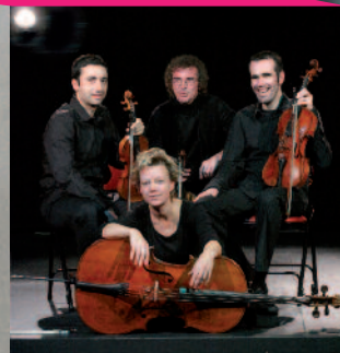
Celtic String Quartet