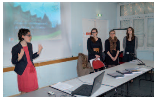
Les étudiants lors de la restitution finale de leur travail, le 4 avril dernier.

Parmi les propositions faites, on peut noter l'idée de transformer les abords du château en un véritable espace public pour les estivants, mais aussi pour les Pontivyens. Un chemin piéton entre la rue Sénéchal-de-Kercado et La Malpaurie serait l'axe principal, grâce à une rampe accessible aux personnes à mobilité réduite. Des allées existantes seraient aménagées et d'autres créées, avec des bancs et des tabourets comme points de repos. Un théâtre de verdure, avec vue sur le Blavet pourrait être réalisé au nord du site. Bien entendu, toutes ces propositions ne sont que des pistes de réflexion. Ces dernières seront examinées par les élus et si elles sont retenues, leur réalisation sera confiée à des cabinets d'architectes.