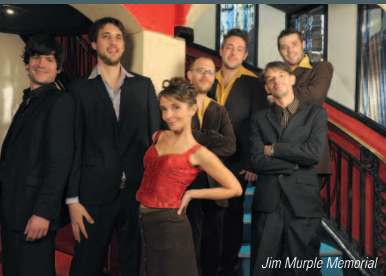
Jim Murple Memorial