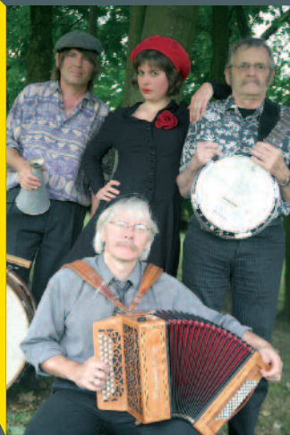
Le Dénécheau Jâse Musette

En cas de mauvaises conditions météorologiques, les concerts auront lieu au Palais des congrès.