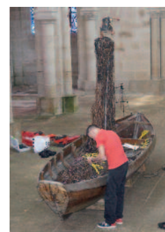
En bas : Les opérateurs du FRAC installent la sculpture de Sarkis au centre de la nef de l'église Saint-Joseph.

Sarkis, de son vrai nom Zabunyan, est né à Istanbul (Turquie). L'œuvre du sculpteur présentée à Pontivy fait partie de la collection du Musée des Beaux-Arts de Nantes. Il s'agit d'un bateau de 7 m de long qui va occuper la nef de l'église. L'ensemble est composé d'une barque hollandaise de la fin du XIX ème siècle, de lettres de néon en cristal posées à l'intérieur de la coque formant le mot « Kriegsschat » (en allemand trésor de guerre) et d'une sculpture japonaise en bois polychrome placée en haut d'une échelle de fer située au milieu du navire.