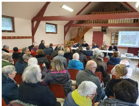
➤ Réunion Publique Salle des associations - Stival