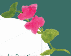
Illustration & Conception graphique : Laura Bigaroli

Traduction : Office publique de la langue bretonne /Ofis ar Brezhoneg